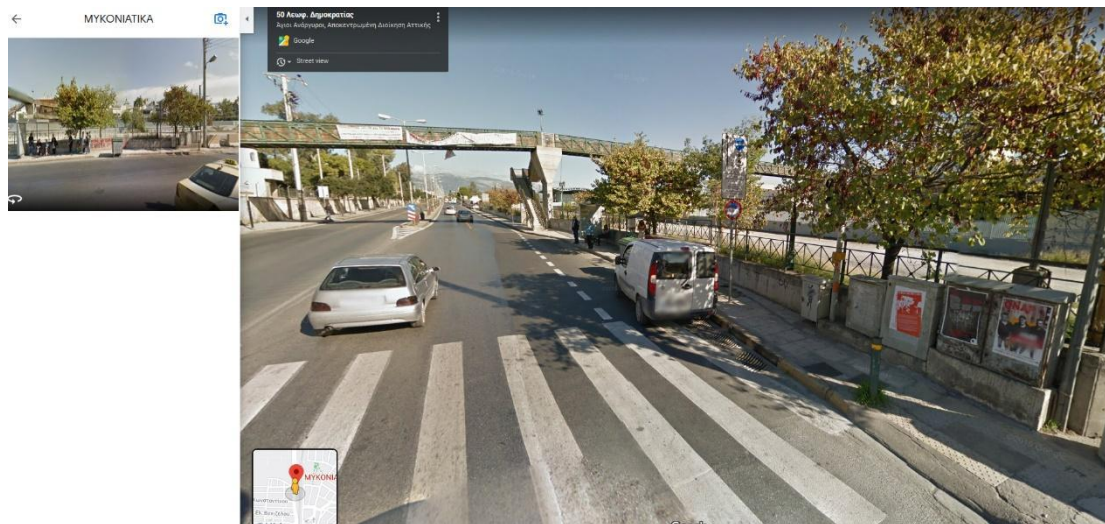
Εικόνα 3: Η στάση του Λεωφορείου (ΜΥΚΟΝΙΑΤΙΚΑ)